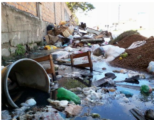
Fotografia 02- Acervo do lixo

Na leitura da Fotografia “Acervo do lixo”, verificamos que a aluna CT expõe sérias preocupações referentes à problemática do lixo, de fato, um grave problema ambiental que vem assumindo grandes dimensões em nossa sociedade. Este, certamente, está relacionado com a disposição atual da nossa sociedade em consumir, ou melhor, de empreender no consumismo. Aliado a essa questão, temos a destacar que não há preocupação com o destino final adequado do lixo produzido. Em realidade, é mínima a sensibilidade ecológica, notadamente no que se refere ao lixo e, também, em relação a outros aspectos que comprometem a qualidade do ambiente. Vejamos, então, o que aponta a aluna: